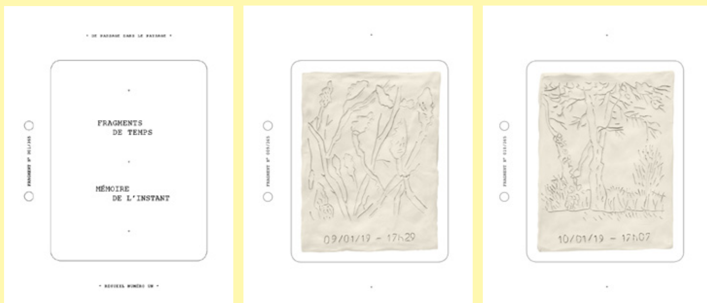
– Fragments de temps, mémoire de l'instant – Fragments de temps, mémoire de l'instant : inventaire. Extraits du recueil numéro un, fragments numérotés 009/365, 010/365 de l'année 2019. Gravure sur plaque d'argile naturelle blanche. Dimensions 220 X 170 X 12 mm.

Dans ce travail d'inventaire sur le temps long, débuté le premier janvier 2019, avec quelle intensité le souvenir de chacun des fragments de temps collectés viendra-t-il s'inscrire dans notre mémoire ? Dans quelle mesure ces instantanés de paysages sensibles auront-ils une influence sur notre vie future?